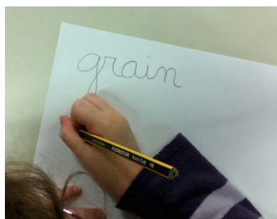
Élève droitier qui cache ce qu'il écrit et gagnerait à placer sa main sous la ligne d'écriture

Il convient surtout d'éviter de laisser les autres enfants énoncer des propos discriminants au sujet des gauchers, c'est une différence ordinaire, au même titre que la couleur des yeux ou des cheveux. Les gauchers ne sont pas plus maladroits que les droitiers, malgré certaines représentations. Il semble même que ce soit un avantage pour certains sports.