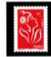
2005 La Marianne des Français Lamsuche