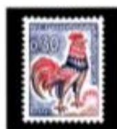
1962 Coq Decaris