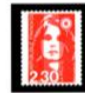
1989 Marianne du Bicentenaire Briat