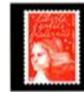
1997 Marianne du 14 juillet Luquet