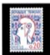
1961 Marianne Cocteau