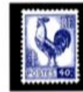
1944 Coq (Alger)