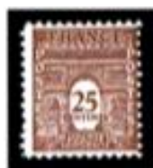
1944 Arc de Triomphe (Washington)