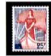
1959 Marianne à la Nef