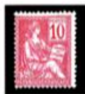
1902 Droits de l'Homme