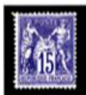
1876 Paix et commerce